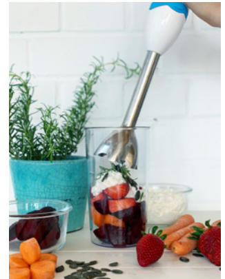
Alle Zutaten werden zu einer cremigen Masse püriert.