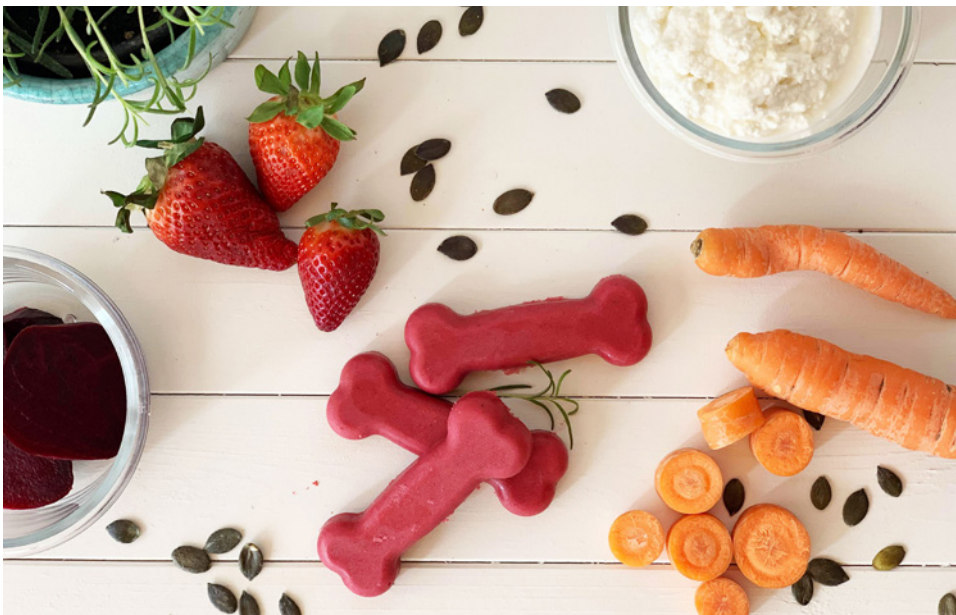
Die „Pinky Bones“ sind mit dem MQ5 VarioFit von Braun im Handumdrehen zubereitet.