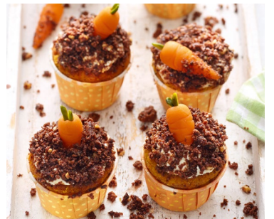
Bei der Verzierung ist Kreativität gefragt.