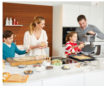
Gemeinsames Backen stärkt den Familienzusammenhalt.