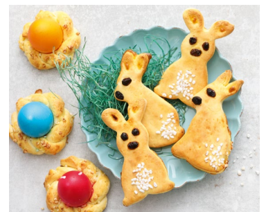
Backzeit ist Familienzeit.