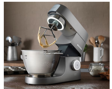
Backmischungen wandern nur sehr selten in die Rührschüssel.