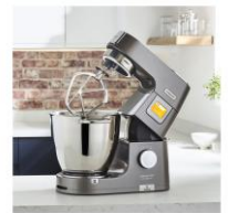
Die neue Titanium Chef Pâtissier XL