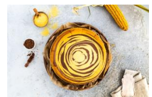
Quark-Zebrakuchen von KochTrotz

Alle weiteren Kuchen und Bildmaterial zum Download hier