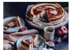
Apfel-Quark-Kuchen von Our Food Stories