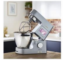
Die neue Cooking Chef XL