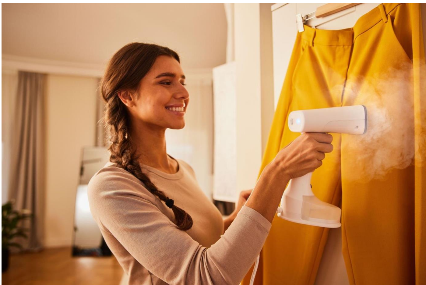
Die FastSteam Technologie der QuickStyle Modelle ermöglicht das Glätten von liegenden und hängenden Textilien.

Große Leistung, kompaktes Design – das bieten die QuickStyle 5 Dampfglätter. Beide Modelle bestechen mit 1.200 Watt Leistung und einem stilvollen Look. In 45 Sekunden sind beide einsatzbereit und liefern bis zu 25 Gramm kontinuierlichen Dampf pro Minute, um Falten schnell und einfach zu entfernen. Der 150-Milliliter-Wassertank ermöglicht das Glätten mehrerer Kleidungsstücke nacheinander und mit einer Kabellänge von 2,5 Metern ist eine vollkommene Armfreiheit während des Glättens gewährleistet. Dank ihres kompakten Designs sind beide Modelle bequem zu lagern und auch perfekt zur Mitnahme auf Reisen geeignet. Der dazugehörige Bürstenaufsatz liefert zusätzlichen Schutz aller Textilien.